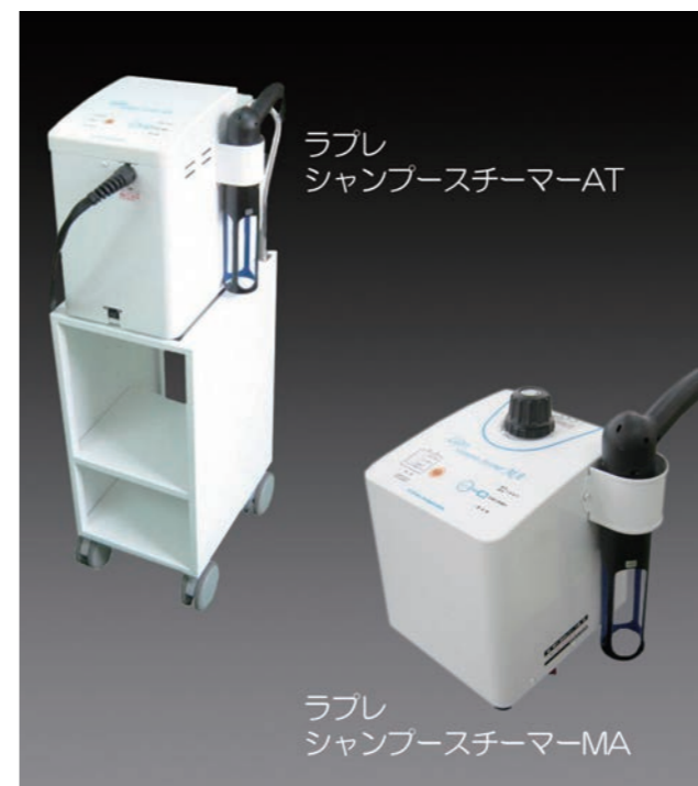
ラプレ シャンプースチーマー 約30センチ四方で6kgとコンパクト。ワゴン付きのポンプ自動給水タイプ(AT)には、軟水装置も付いている。

ヘアスチーマーは、水分含有が少ない蒸気を使うため、髪に当たっても水滴が付きませんが、シャンプー用には一定の水分がないと髪へのダメージが大きくなり、爽快感も得られません。そこで、シャンプースチーマーでは、本体に内蔵された圧力釜で加熱した120℃の水蒸気をノズルから噴出する過程で障害物に接触